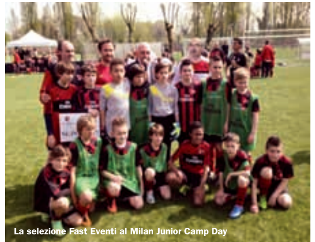
La selezione Fast Eventi al Milan Junior Camp Day