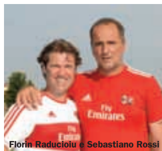
Florin Raducioiu e Sebastiano Rossi